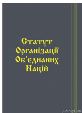
Статут Організації Об'єднаних Націй. Паливода