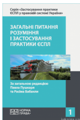
Загальні питання розуміння і застосування практики ЄСПЛ. Том 1