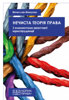
Нечиста теорія права. 3 елементами квантової юриспруденції