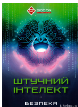
Штучний інтелект і безпека