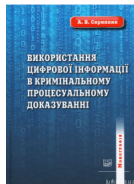
Використання цифрової інформації у кримінальному процесуальному доказуванні

Перейти до галузі права Міжнародне право