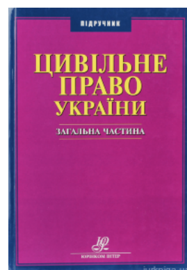
Цивільне право України. Загальна частина. Підручник