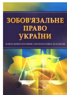
Зобов'язальне право України. Навчальний посібник для підготовки до іспитів