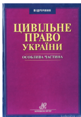
Цивільне право України. Особлива частина