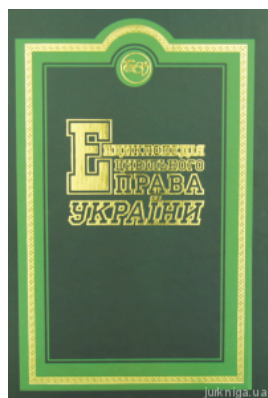
Енциклопедія цивільного права України