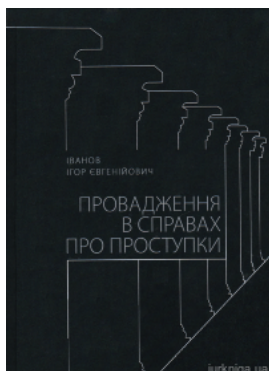
Провадження в справах про проступки