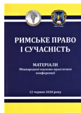
Римське право і сучасність. Епідемії в Європі і право: від Риму до COVID-19. Матеріали Міжнародної науково-практичної конференції