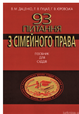
93 питання з сімейного права. Посібник для суддів