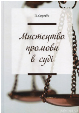
Мистецтво промови в суді