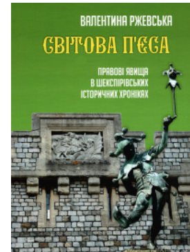
Світова п'єса. Правові явища в шекспірівських історичних хроніках. Видання друге