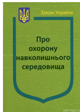
Закон України "Про охорону навколишнього природного середовища"