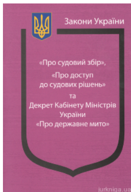
Закони України "Про судовий збір", "Про доступ до судових рішень" та Декрет Кабінету Міністрів України "Про державне..."