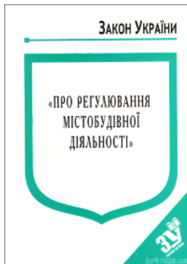
Закон України "Про регулювання містобудівної діяльності"