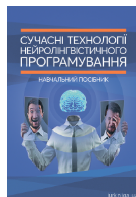
Сучасні технології нейролінгвістичного програмування