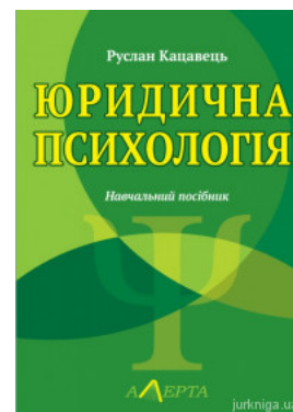
Юридична психологія. Навчальний посібник

Перейти до галузі права Філософія та психологія права