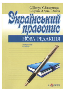
Український правопис: нова редакція. Навчальний посібник