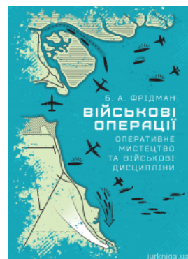
Військові операції: оперативне мистецтво та військові дисципліни