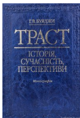
Траст: історія, сучасність, перспективи