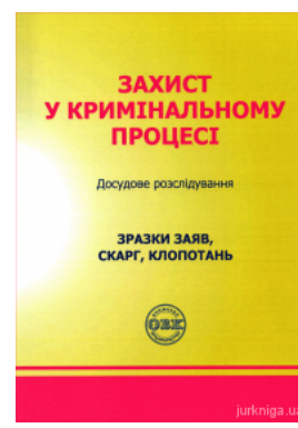
Захист у кримінальному процесі. Досудове розслідування: Зразки заяв, скарг, клопотань