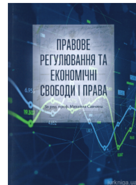
Правове регулювання та економічні свободи і права

Перейти до галузі права Європейське право