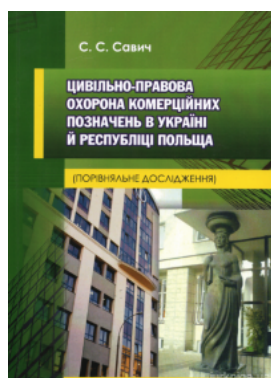
Цивільно-правова охорона комерційних позначень в Україні й Республіці Польща