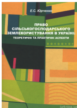
Право сільськогосподарського о землекористування в Україні: теоретичні та практичні аспекти