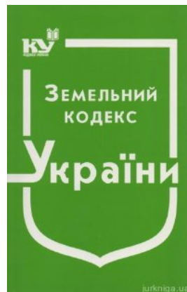
Земельний кодекс України