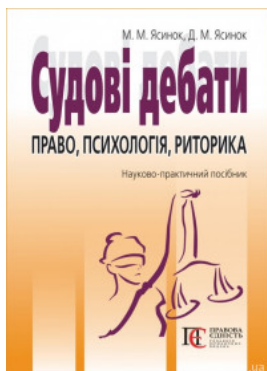
Судові дебати: право, психологія, риторика. Видання третє