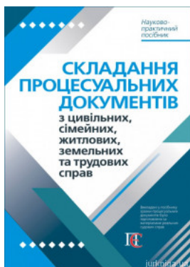
Складання процесуальних документів з цивільних, сімейних, житлових, земельних та трудових справ