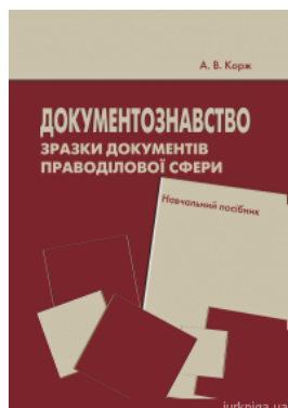
Документознавство. Зразки документів праводілової сфери