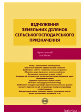
Відчуження земельних ділянок сільськогосподарського о призначення