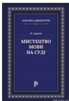
Мистецтво мови на суді