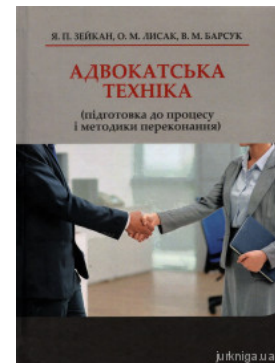
Адвокатська техніка (підготовка до процесу і методики переконання)