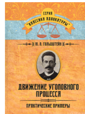
Движение уголовного процесса. Практические примеры