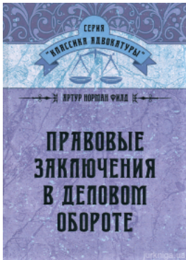
Правові заключення в деловому обороті