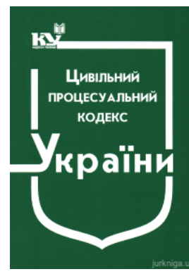
Цивільний процесуальний кодекс України