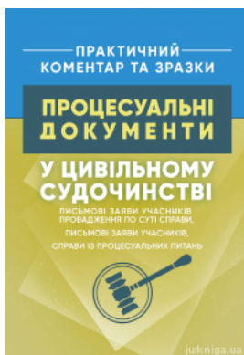
Процесуальні документи у цивільному судочинстві: письмові заяви учасників провадження по суті справи, письмові заяви учасників, справи із...