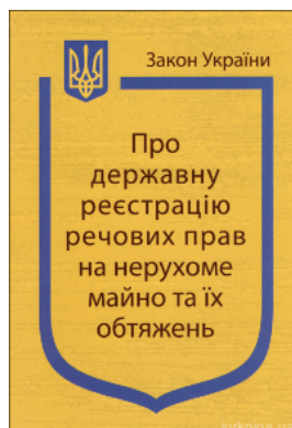
Закон України "Про державну реєстрацію речових прав на нерухоме майно та їх обтяжень"