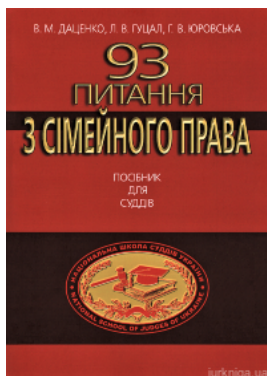
93 питання з сімейного права. Посібник для суддів