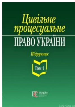
Цивільне процесуальне право України. Підручник. Том 1