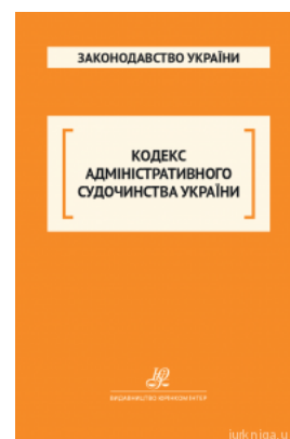
Кодекс адміністративного судочинства України. Юрінком Інтер

Перейти до галузі права Цивільне право та процес