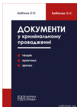
Документи у кримінальному провадженні (теорія, практика застосування, зразки)