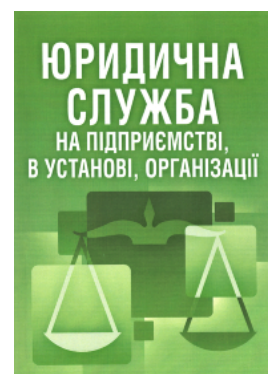
Юридична служба на підприємстві