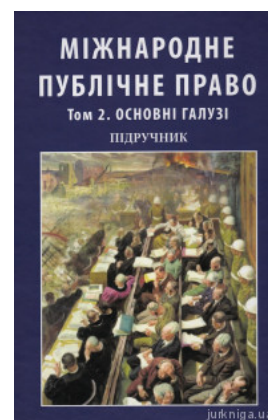
Міжнародне публічне право. Том 2. Основні галузі. У двох томах