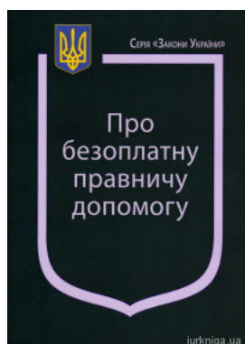
Закон України “Про безоплатну правничу допомогу”