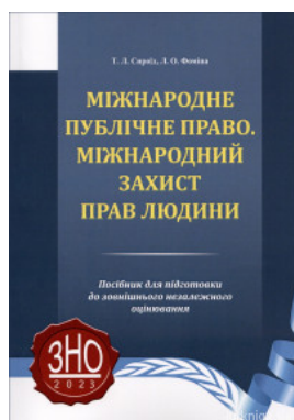
Міжнародне публічне право. Міжнародний захист прав людини: посібник для підготовки до зовнішнього незалежного оцінювання