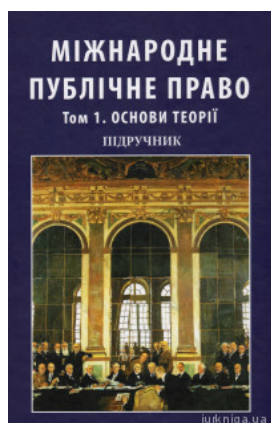
Міжнародне публічне право. Том 1. Основи теорії. У двох томах