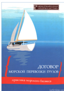
Договор морской перевозки грузов