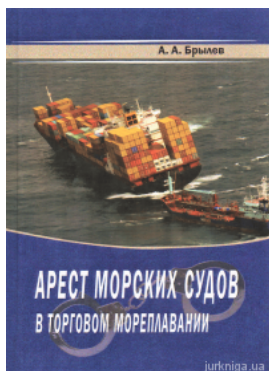
Арест морских судов в торговом мореплавании