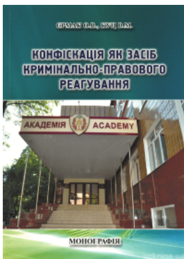
Конфіскація як засіб кримінально-правового реагування