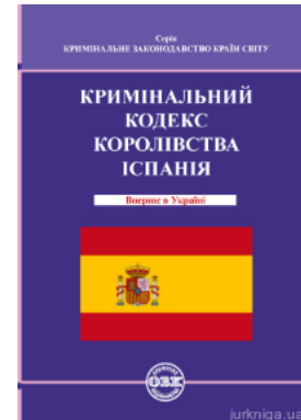
Кримінальний кодекс Королівства Іспанія