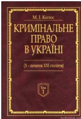
Кримінальне право України (X-початок XXI століття). У 2-х томах