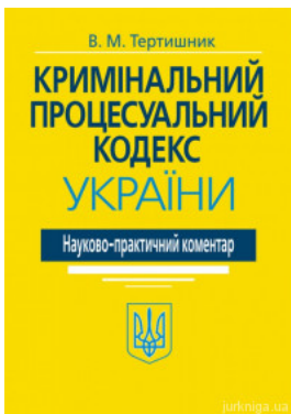
Науково-практичний коментар Кримінального процесуального кодексу України. Видання 20-те