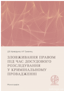
Зловживання правом під час досудового розслідування у кримінальному провадженні