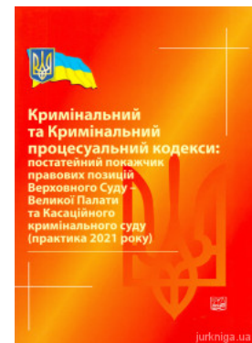
Кримінальний та Кримінальний процесуальний кодекси: постатейний показник правових позицій Верховного Суду - Великої Палати та Касаційного...

Перейти до галузі права Кримінальне право та процес