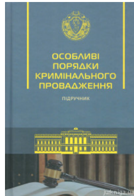
Особливі порядки кримінального провадження. Підручник