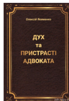
Дух та пристрасті адвоката