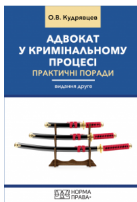
Адвокат у кримінальному процесі. Практичні поради. Видання друге