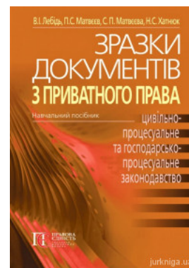
Зразки документів з приватного права (цивільне, сімейне, житлове, трудове, земельне, цивільно-процесуальне та госпо-дарсько-процес уальне...

Перейти до галузі права Історія держави та права