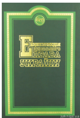
Енциклопедія цивільного права України