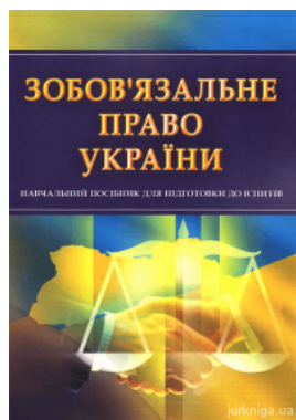
Зобов'язальне право України. Навчальний посібник для підготовки до іспитів