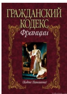
Гражданский кодекс Франции (Кодекс Наполеона)