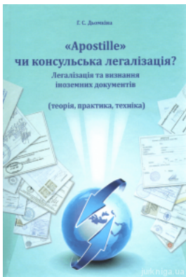
Аpostille чи консульська легалізація? Легалізація та визнання іноземних документів (теорія, практика, техніка)