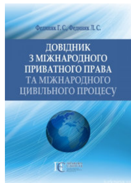
Довідник з міжнародного приватного права та міжнародного цивільного процесу