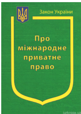
Закон України “Про міжнародне приватне право”