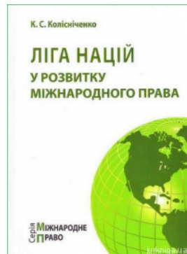
Ліга Націй у розвитку міжнародного права