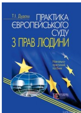
Практика Європейського суду з прав людини