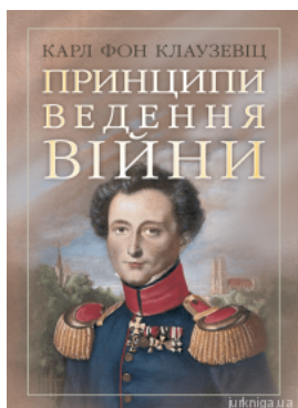
Принципи ведення війни