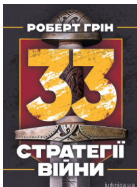
33 стратегії війни