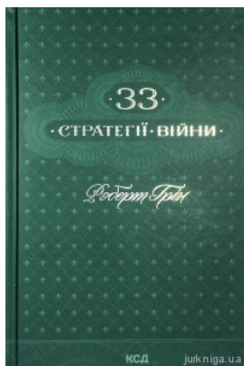
33 стратегії війни