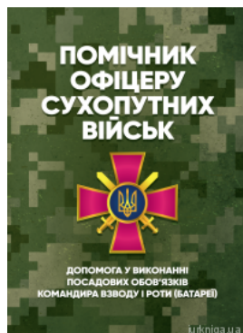
Помічник офіцера Сухопутних військ. Допомога у виконанні посадових обов'язків командира взводу і роти (батареї)