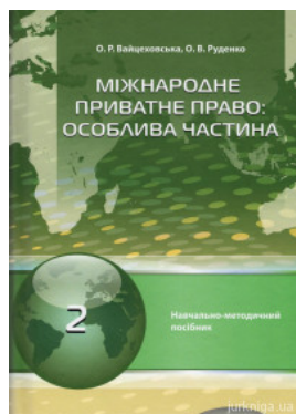
Міжнародне приватне право. Особлива частина