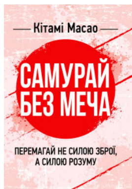
Самурай без меча. Перемагай не силою зброї, а силою розуму