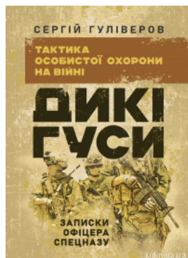
Дикі гуси. Тактика особистої безпеки на війні. Записки офіцера спецназу