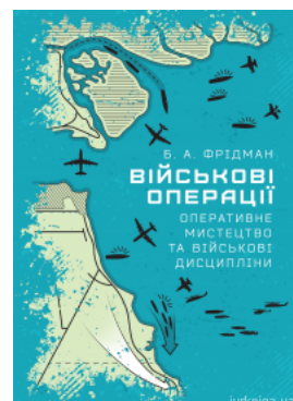
Військові операції: оперативне мистецтво та військові дисципліни