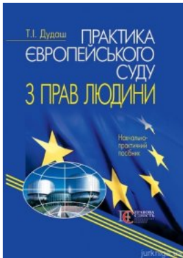
Практика Європейського суду з прав людини