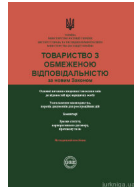
Товариство з обмеженою відповідальністю за новим законом