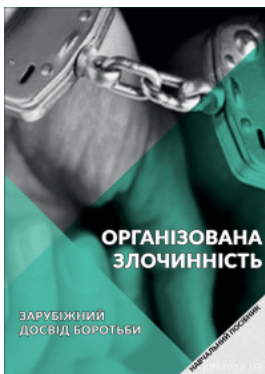
Організована злочинність: зарубіжний досвід боротьби