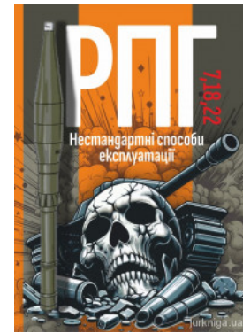
РПГ 7, 18, 22. Нестандартні способи експлуатації