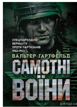
Самотні воїни. Спецпідрозділи вермахту проти партизанів 1942-1943