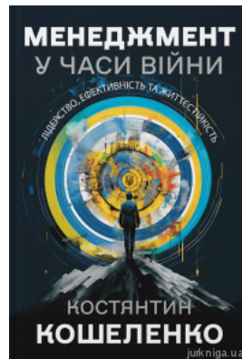
Менеджмент у часи війни