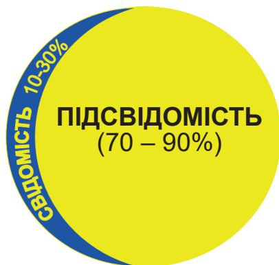
Рис. 1.1. Складові психіки людини.

появі принципово нових методів лікування тощо. З іншого боку, з'являється можливість створення новітніх засобів збройної боротьби на базі систем прихованих інформаційних впливів, спрямованих на пряме маніпулювання підсвідомістю людини.