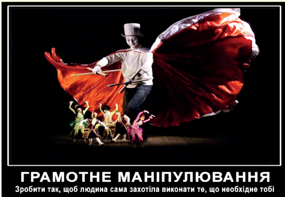
Рис. 1.2. Перетворення людини на слухняне знаряддя, “маріонетку”.

Тобто, маніпулювання в переносному значенні – це прагнення “прибрати до рук”, “приручити” іншого, “заарканити”, “піймати на гачок”, спроба перетворити людину на слухняне знаряддя, “маріонетку”. Проте метафора “прибирання до рук” хоча і є стрижневою ознакою, але зовсім не єдиною щодо психологічного маніпулювання.