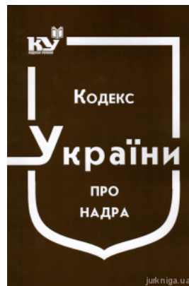
Кодекс України про надра