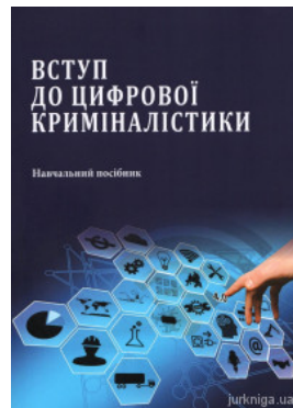
Вступ до цифрової криміналістики