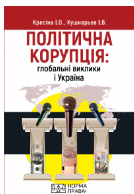
Політична корупція: глобальні виклики і Україна