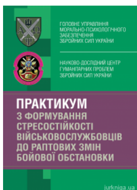
Практикум з формування стресостійкості військовослужбовців до раптових змін бойової обстановки

Перейти до галузі права Міжнародне право