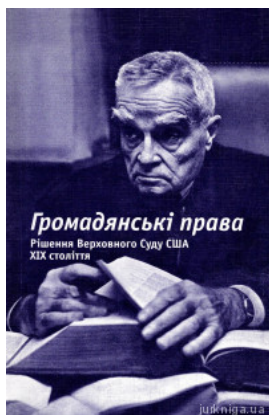
Громадянські права. Рішення Верховного Суду США. XIX століття