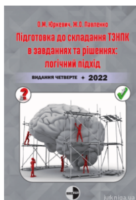
Підготовка до складання ТЗНПК в завданнях та рішеннях: логічний підхід