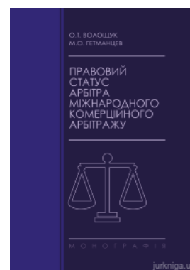
Правовий статус арбітра міжнародного комерційного арбітражу

Перейти до галузі права Міжнародне право