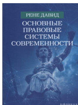
Основні правові системи сучасності