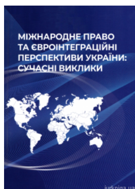
Міжнародне право та євроінтеграційні перспективи України: сучасні виклики