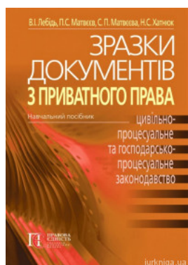
Зразки документів з приватного права (цивільне, сімейне, житлове, трудове, земельне, цивільно-процесуальне та госпо-дарсько-процесуальне...)