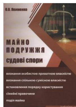
Майно подружжя. Судові спори