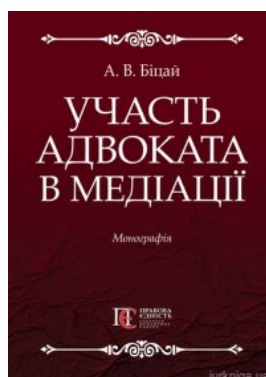
Участь адвоката в медіації