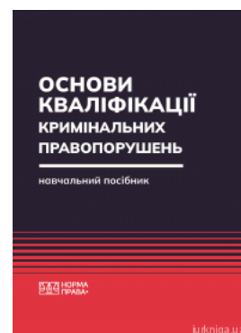
Основи кваліфікації кримінальних правопорушень