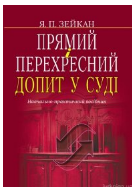
Прямий і перехресний допит у суді