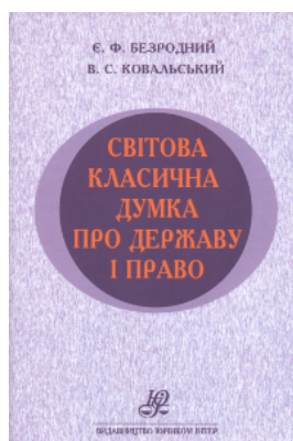
Світова класична думка про державу і право