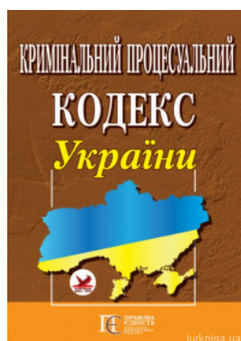
Кримінальний процесуальний кодекс України. Алерта