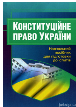
Конституційне право України. Навчальний посібник для підготовки до іспитів