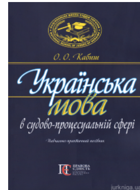
Українська мова в судово-процесуальній сфері. Навчально-практичний посібник. Видання друге