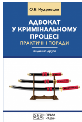
Адвокат у кримінальному процесі. Практичні поради. Видання друге