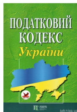
Податковий кодекс України. Алерта