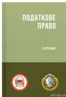
Податкове право України. Підручник