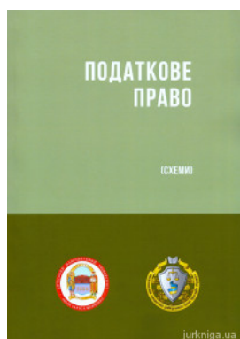
Податкове право. Схеми