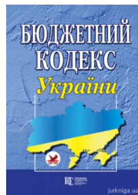
Бюджетний кодекс України. Алерта