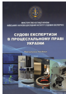
Судові експертизи в процесуальному праві України. Навчальний посібник