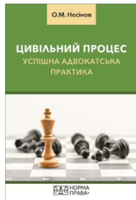
Цивільний процес. Успішна адвокатська практика