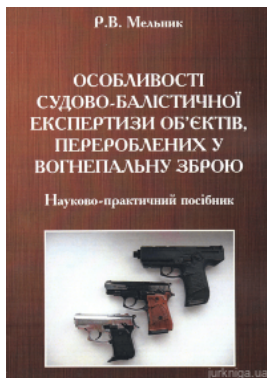
Особливості судово-балістичної експертизи об'єктів, перероблених у вогнепальну зброю