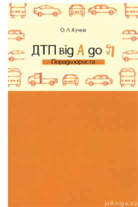
ДТП від А до Я. Поради юриста