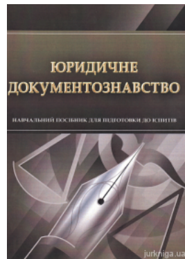
Юридичне документознавство. Навчальний посібник для підготовки до іспитів