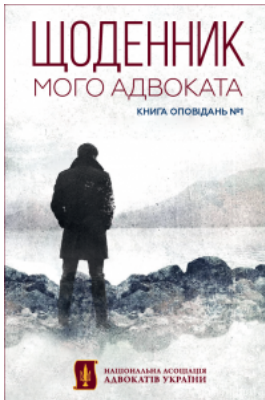
Щоденник мого адвоката. Книга оповідань №1