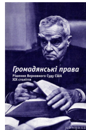
Громадянські права. Рішення Верховного Суду США. XIX століття

Перейти до галузі права Адміністративне право