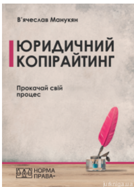
Юридичний копірайтинг. Прокачай свій процес