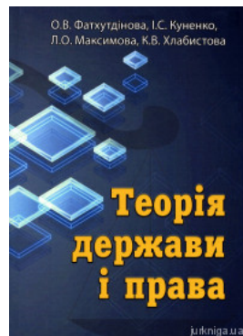
Теорія держави і права