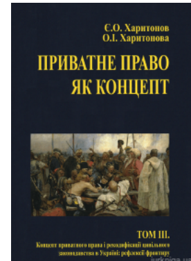
Приватне право як концепт. Том 3. Концепт приватного права і рекодифікації цивільного законодавства в Україні: рефлексії фронтиру