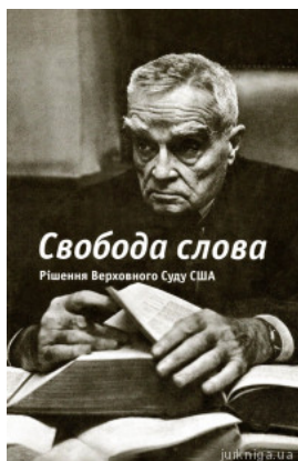
Свобода слова. Рішення Верховного Суду США