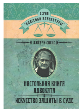
Настольная книга адвоката. Искусство защиты в суде