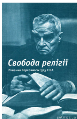
Свобода релігії. Рішення Верховного Суду США