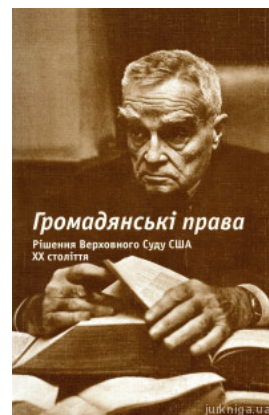
Громадянські права. Рішення Верховного Суду США. XX століття