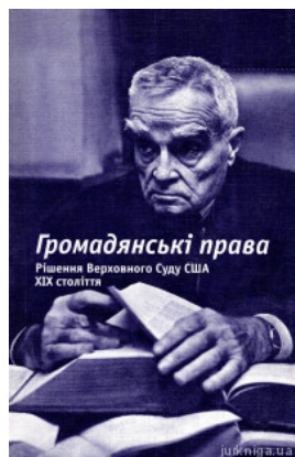
Громадянські права. Рішення Верховного Суду США. XIX століття