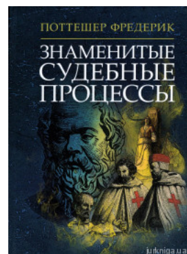
Знаменитые судебные процессы

Перейти до галузі права Теорія держави і права