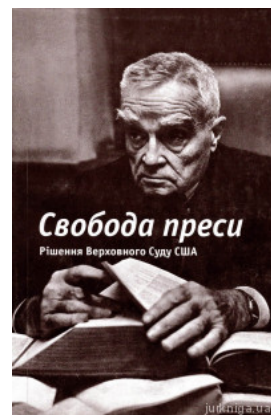
Свобода преси. Рішення Верховного Суду США