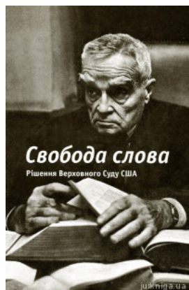
Свобода слова. Рішення Верховного Суду США