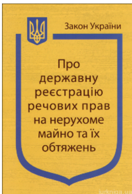
Закон України “Про державну реєстрацію речових прав на нерухоме майно та їх обтяжень”