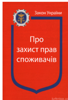
Закон України “Про захист прав споживачів”