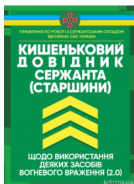
Кишеньковий довідник сержанта (старшини) щодо використання деяких засобів вогневого враження