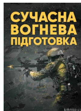
Сучасна вогнева підготовка