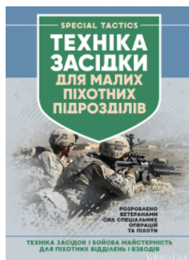
Техніка засідки для малих піхотних підрозділів