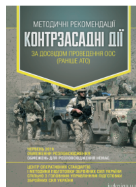
Методичні рекомендації "Контрзасадні дії" (за досвідом проведення ООС (раніше АТО))