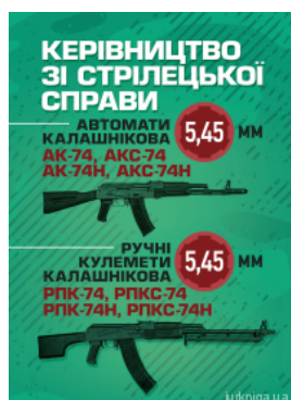
Керівництво зі стрілецької справи 5,45-мм автомати Калашнікова (АК-74, АКС-74, АК-74Н, АКС-74Н) та 5,45-мм ручні кулемети Калашнікова (РПК-74,...