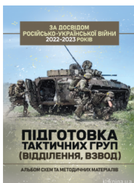
Підготовка тактичних груп (відділення, взвод). Альбом схем та методичних матеріалів