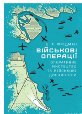
Військові операції: оперативне мистецтво та військові дисципліни