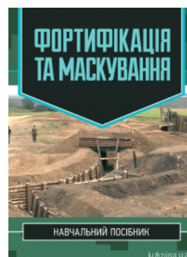
Фортифікація та маскування