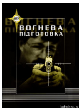
Вогнева підготовка. Навчальний посібник