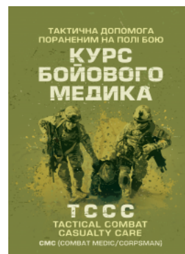
Тактична допомога пораненим на полі бою. Курс бойового медика