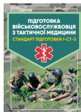
Підготовка військовослужбовця з тактичної медицини. Стандарт підготовки І-СТ-3