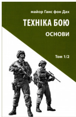
Техніка бою. Основи. Том 1. Частина 2