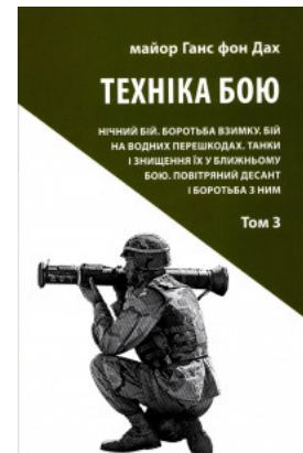
Техніка бою. Нічний бій. Боротьба взимку. Бій на водних перешкодах. Танки і знищення їх у ближньому бою. Повітряний десант і боротьба з ним. Том 3