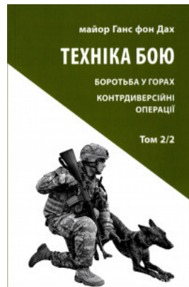
Техніка бою. Боротьба у горах. Контрдиверсійні операції. Том 2. Частина 2