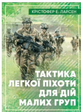
Тактика легкої піхоти для дій малих груп