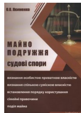
Майно подружжя. Судові спори

Перейти до галузі права Цивільне право та процес