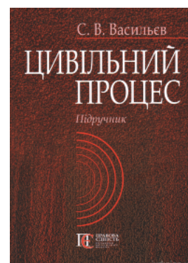
Цивільний процес. Підручник